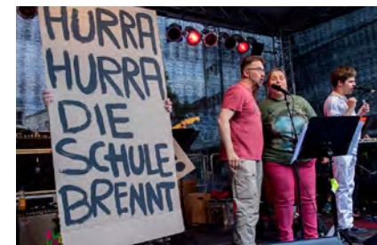
NICHT-IDEAL (DEUTSCHLAND): KARAOKE MIT BARNER 16 LIVE BÜHNE AN DER STIFTSKIRCHE 16.7.2017