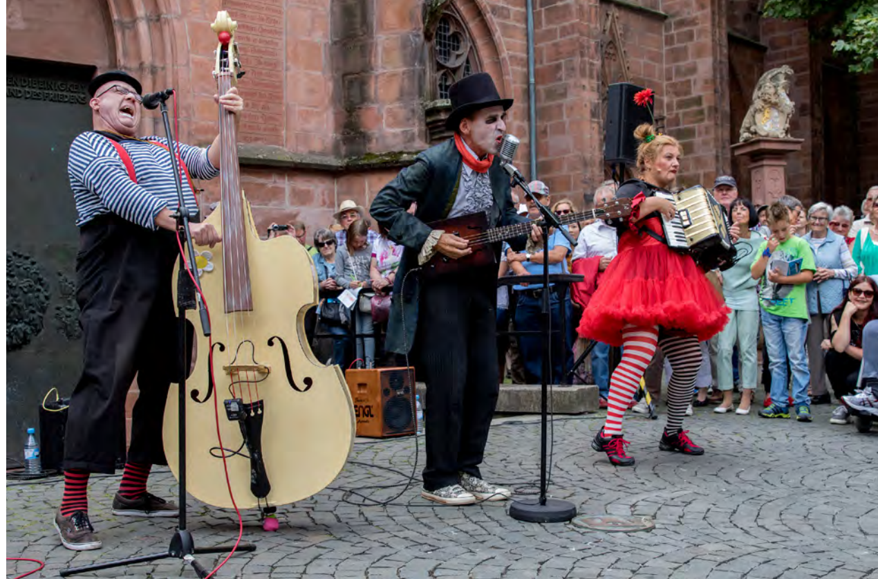
THE BOMBASTICS (DEUTSCHLAND): BE BOB A LUNA VOR DER STIFTSKIRCHE 15. & 16.7.2017