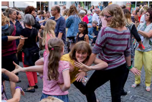
TANZBAR_BREMEN (DEUTSCHLAND): TANZ DA! VOR DER STIFTSKIRCHE 15. & 16.7.2017