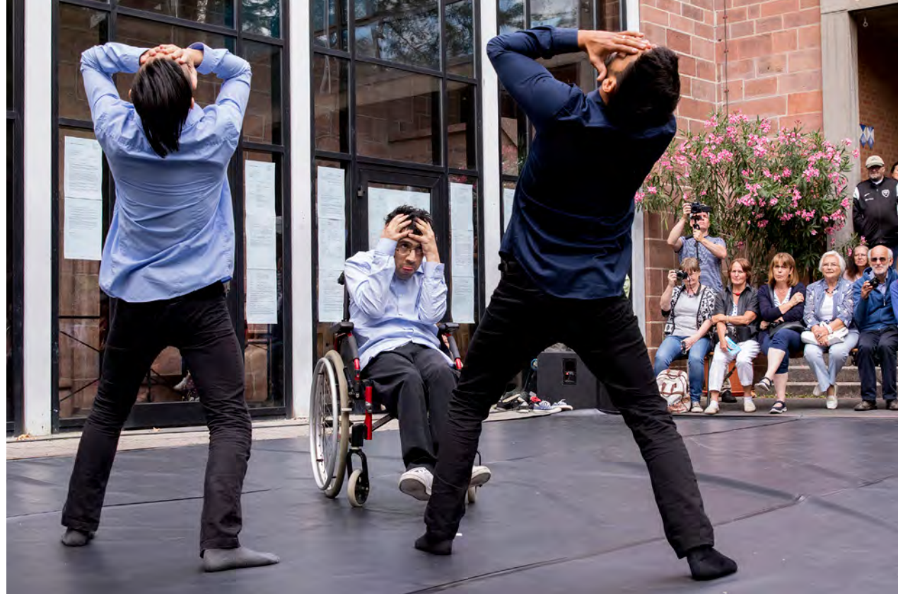
CIE DK-BEL (FRANKREICH): EN TOUTES CONFIANCES HOF STIFTSKIRCHE 15. & 16.7.2017