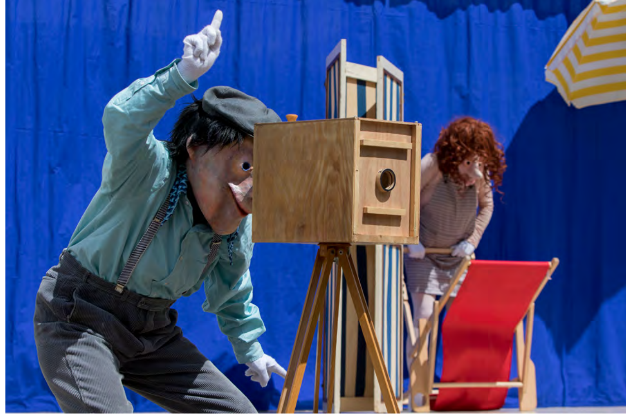
BLAUMEIER-ATELIER (DEUTSCHLAND): CAMERA OBSCURA STOCKHAUSPLATZ 14., 15. & 16.7.2017