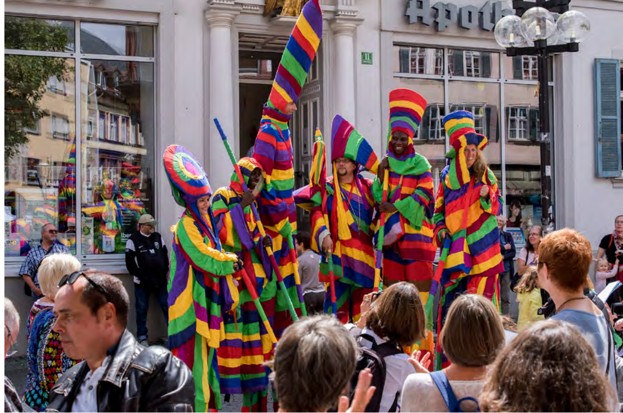
DIE STELZENSIPPE (DEUTSCHLAND): DIE GEWICKELTEN START AN DER STIFTSKIRCHE 15. & 16.7.2017