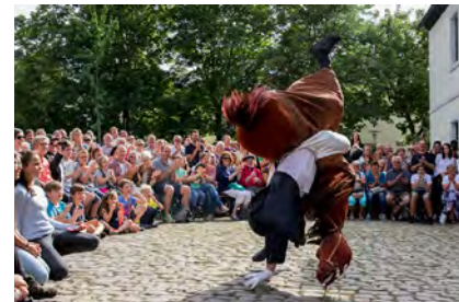
LES GOULUS (FRANKREICH): LES HORSEMEN START MARTINSPLATZ 15. & 16.7.2017