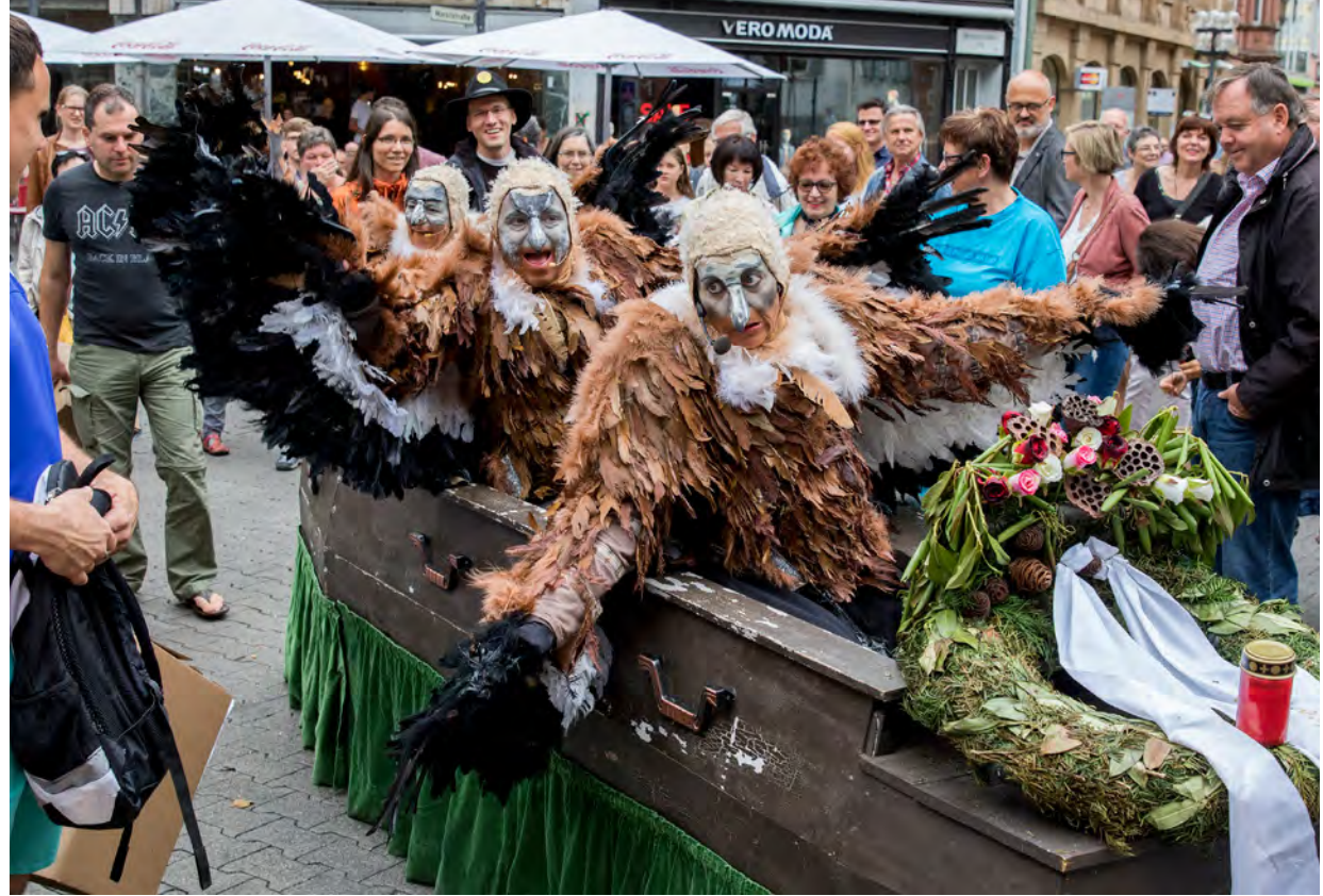
THEATER PIKANTE (DEUTSCHLAND): GEIER AUF HÖHENFLUG START AM ALTENHOF / START AN DER STIFTSKIRCHE 15. & 16.7.2017