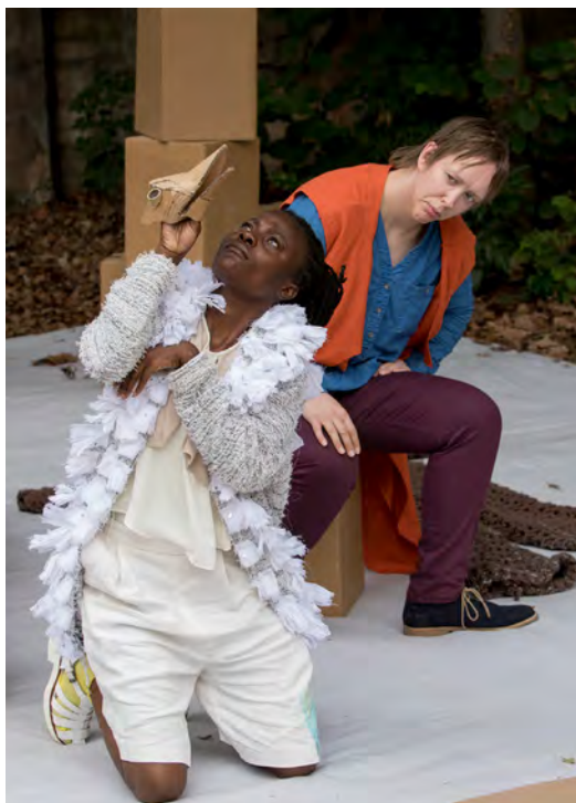
MEINE DAMEN UND HERREN (DEUTSCHLAND): GANS DER BÄR WIESE ST. MARTIN 15. & 16.7.2017