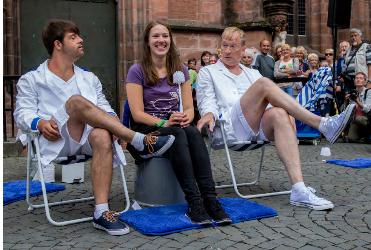
TANZBAR_BREMEN (DEUTSCHLAND): KLMOBIL – EINE SAUBERE SACHE VOR DER STIFTSKIRCHE 15. & 16.7.2017