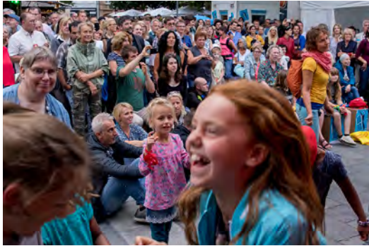
THE PIGS (AUSTRALIEN) BÜHNE AN DER STIFTSKIRCHE / MARTINSPLATZ 15. & 16.7.2017