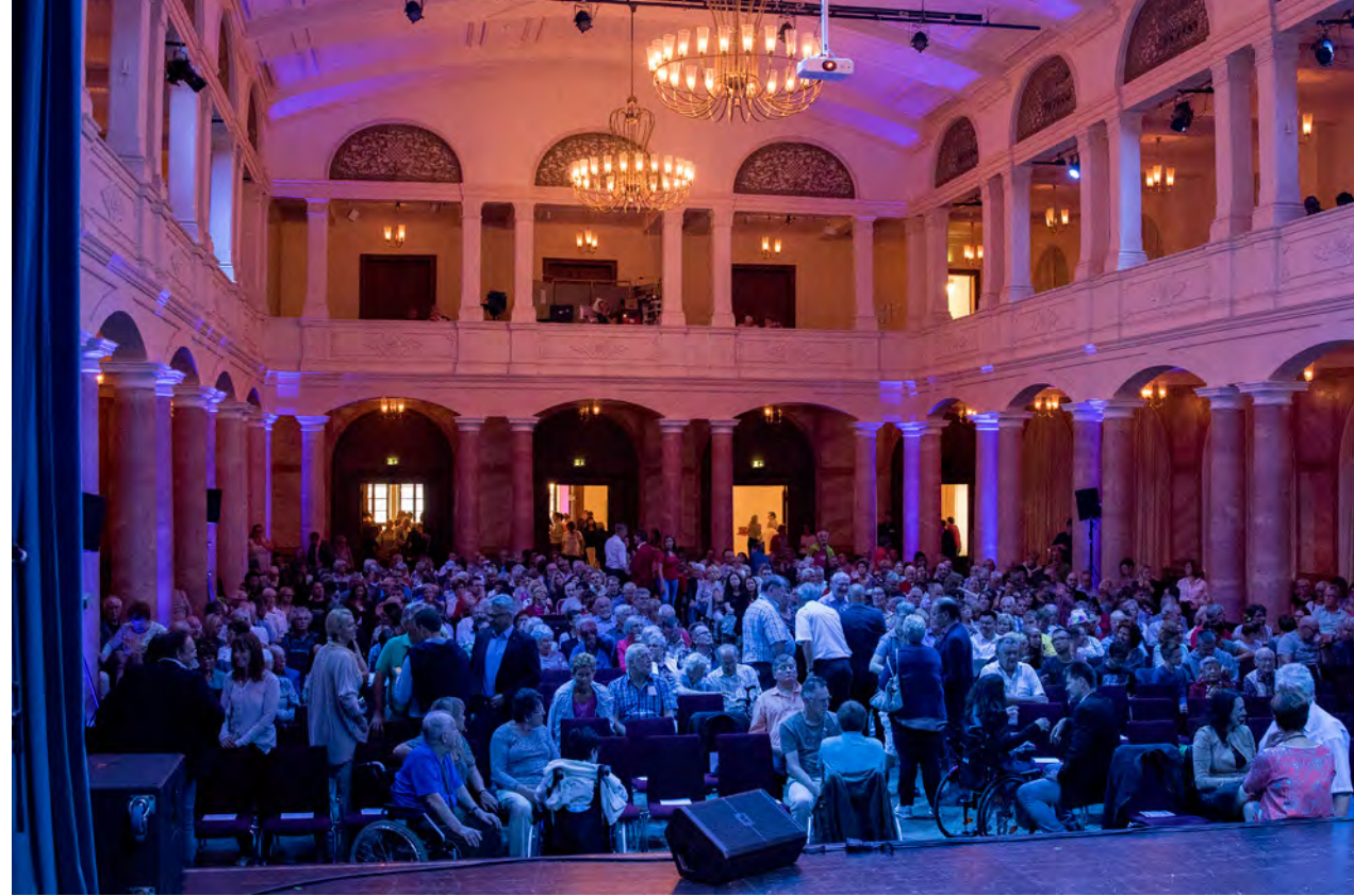
ALLES MUSS RAUS REVUE FRUCHTHALLE 14.7.2017