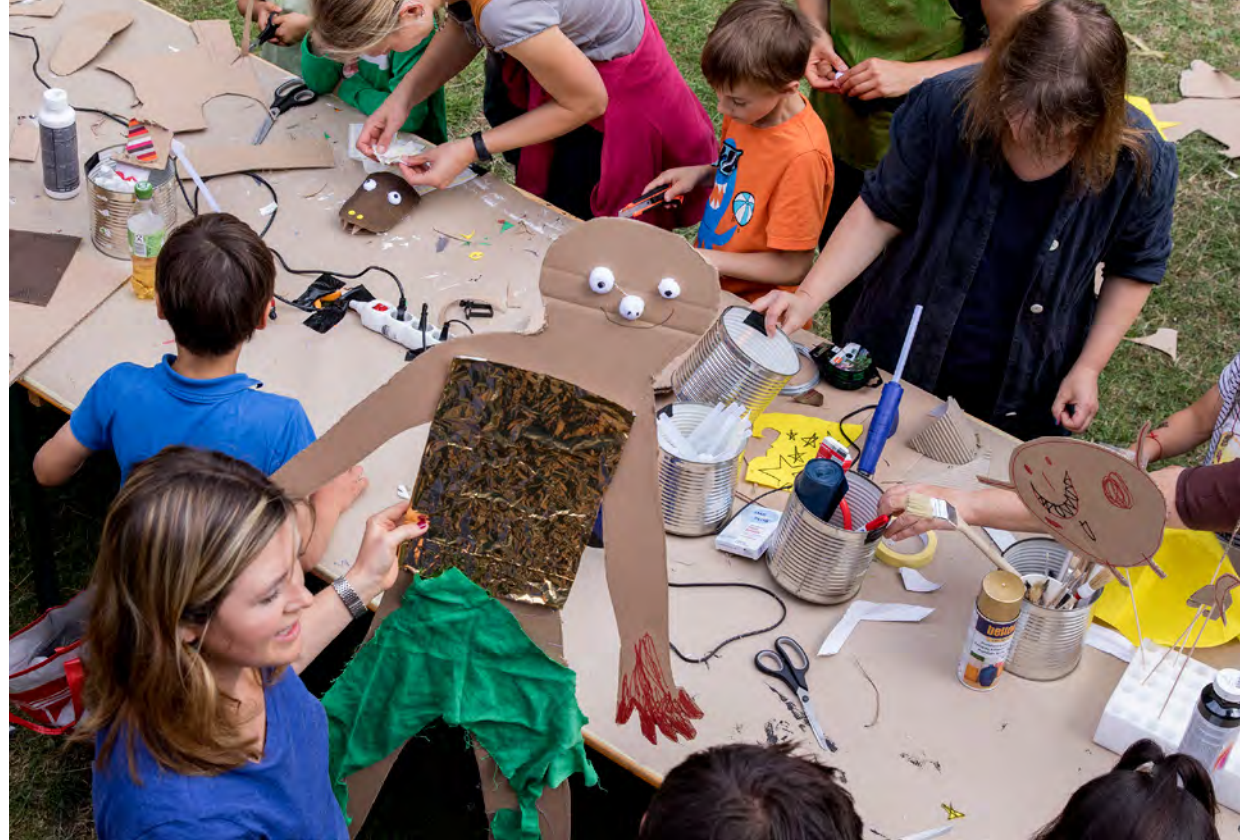
MEINE DAMEN UND HERREN (DEUTSCHLAND): WORKSHOP PUPPENBAU UND -SPIEL WIESE ST. MARTIN 15. & 16.7.2017