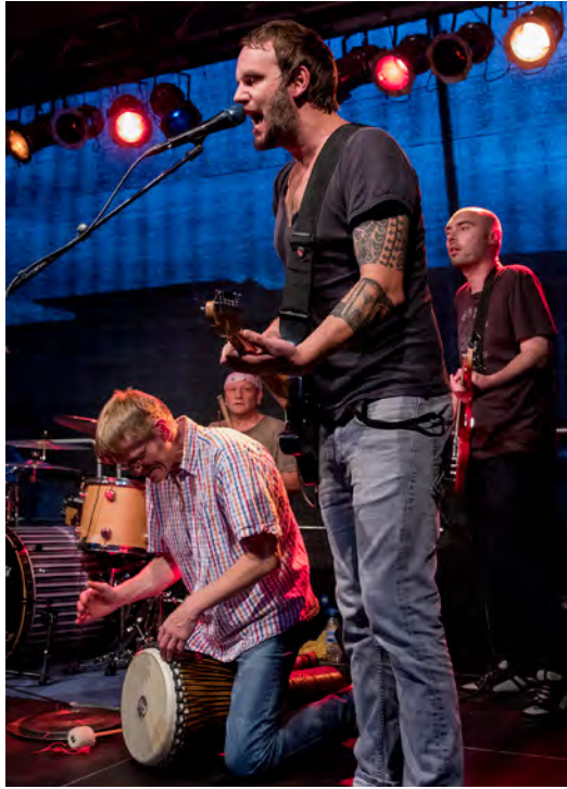
KOSMONOVSKI (DEUTSCHLAND) BÜHNE AN DER STIFTSKIRCHE 14.7.2017