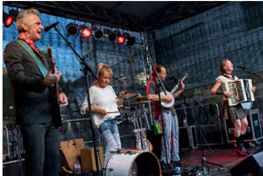
THE BEEZ (AUS/D/USA) MARTINSPLATZ/BÜHNE AN DER STIFTSKIRCHE 15. & 16.7.2017