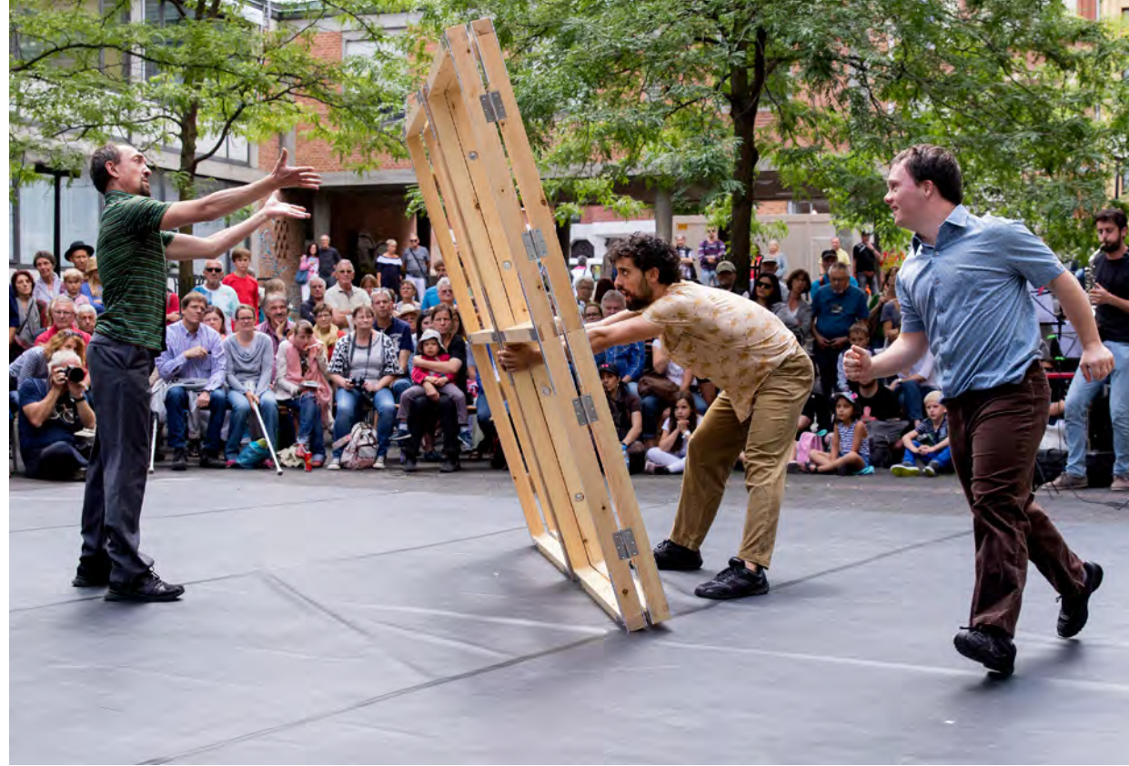
DANZA MOBILE (SPANIEN): EN VANO HOF STIFTSKIRCHE 15. & 16.7.2017