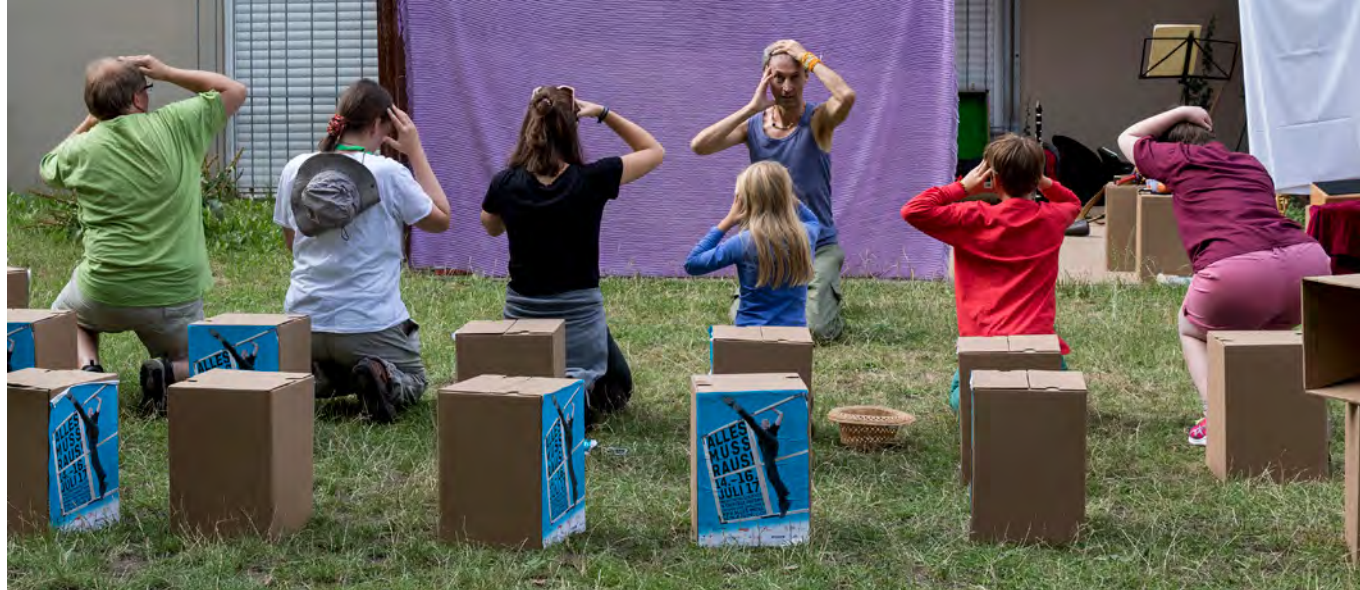
TRIO OKANI (DEUTSCHLAND): WORKSHOP THEATER UND MUSIK WIESE ST. MARTIN 15. & 16.7.2017