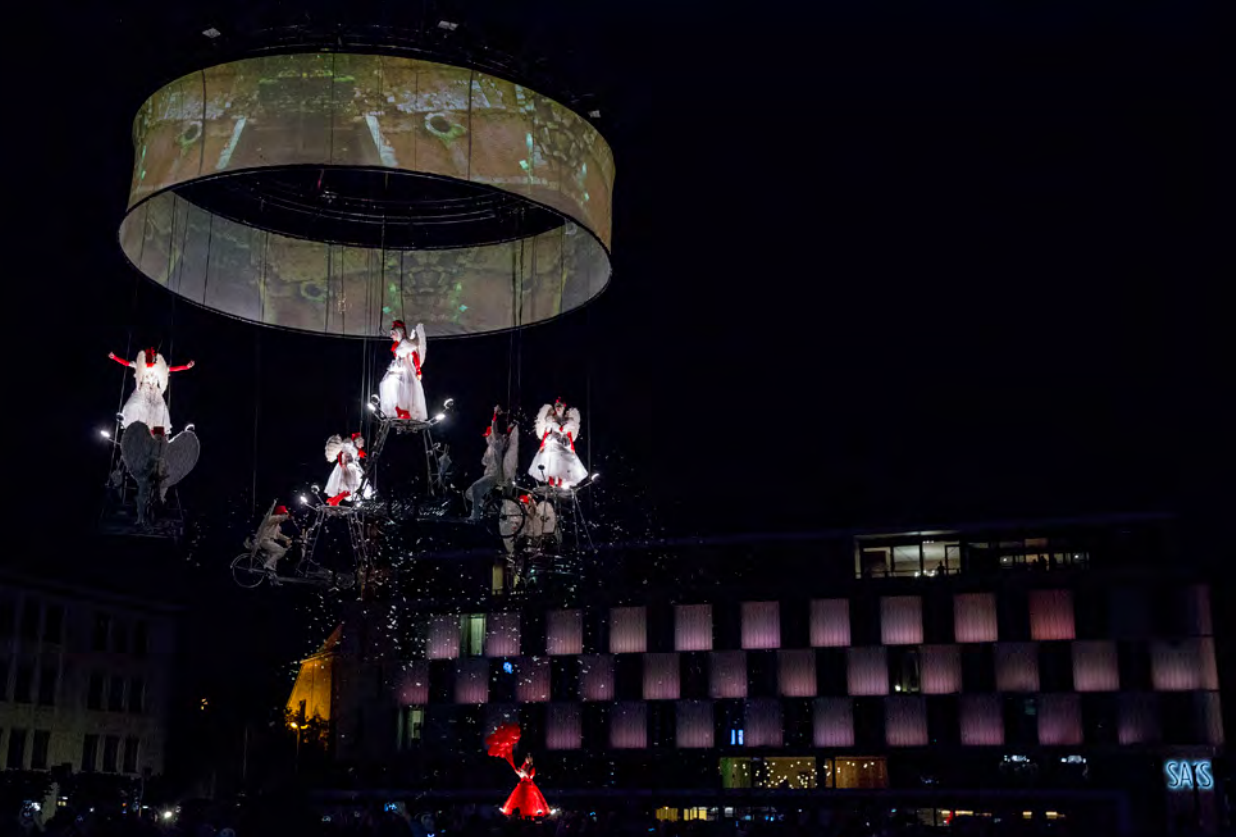
THEATER TOL (BELGIEN): PEDALEANDO HACIA EL CIELO STIFTSPLATZ 14. & 15.7.2017