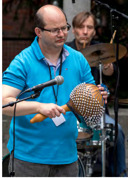
QUALM 4 (DEUTSCHLAND) UNIONPLATZ 15. & 16.7.2017